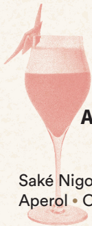
Aki No Kumo 16

Saké Nigori • Cinzano • Aperol • Citron • Blanc d'œuf