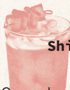
Shiso Smash 12

Cranberry • Orange • Calpico • Lime • Sakura sugar • Cornflower